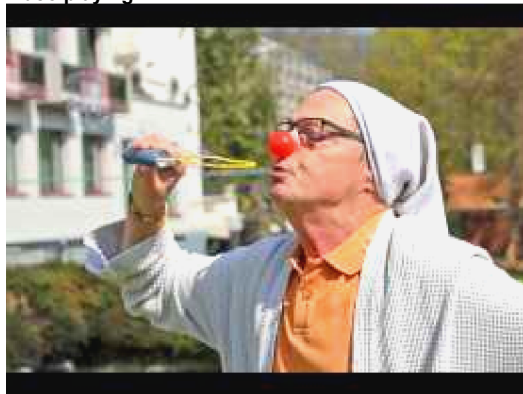
Les longs-nés imitent le public au Cwarmê de...